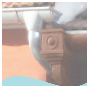
Ochrana okapů před namrzáním