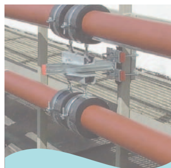
Ochrana potrubí před zamrzáním