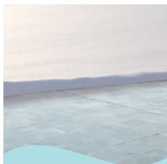
Ochrana venkovních ploch před náledím